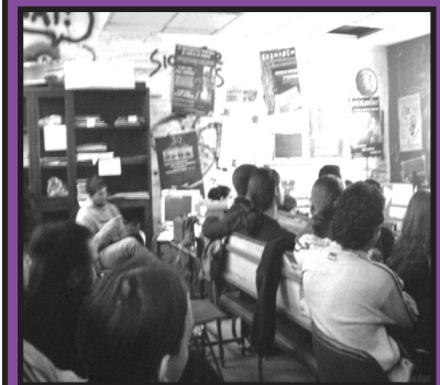
Από την προβολή στις 13 Νοεμβρίου 2006 και τα σχετικά με τις φοιτητικές κινητοποιήσεις ταμπλό που είχαν στηθεί έξω από το στέκι.