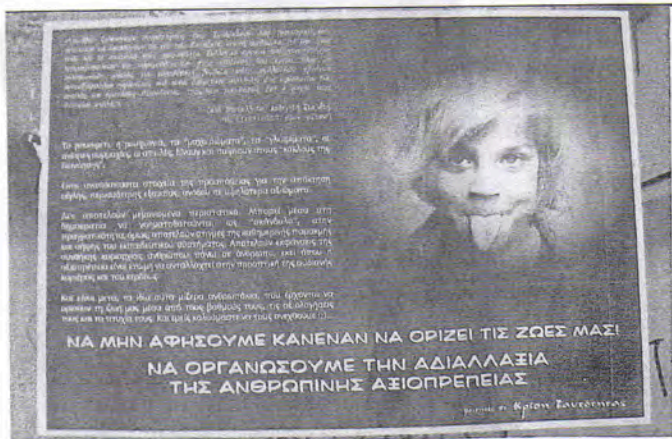
αφίσκι που κολλήθηκε στην Πάντειο και στα πέριξ των ανοίξεj. Και το οποίο σκίστηκε με μανία...

"Μπράβοj ξυλοκοπούν συναδέλφους σας. Συνάδελφοι σας τρομοκρατημένοι αρνούνται να καταθέσουν σε ΕΔΕ που διατάξατε, επειδή φοβούνται για την υγεία τους και την σωματική τους ακεραιότητα. Συλλογικά όργανα του πανεπιστημίου τρομοκρατούνται και παρεμποδίζονται στην εκτέλεση του έργου τους με τηλεφωνικές απειλές για τοποθέτηση βομβών. Μέλη συλλογικών οργάνων αυτοεξαιρούνται παρανόμως από αυτά. Διοικητικοί υπάλληλοι σας υφίστανται βία, απειλές και προτάσεις δωροδοκίας. Υποψήφιοι για θέσεις ΔΕΠ ή οικείοι δέχονται απειλές".