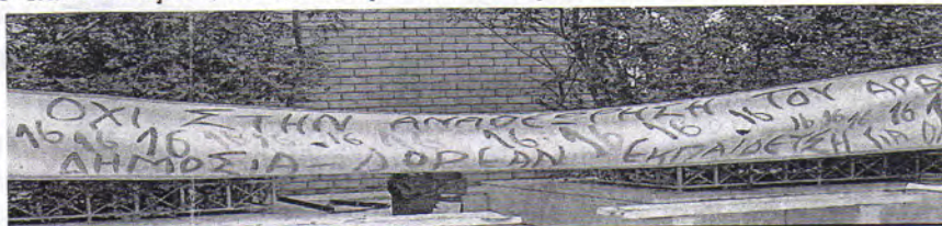
Όχι! Δεν πρόκειται για βουντού αλλά για περίπτωση φετιχισμού: Την προεκλογική περίοδο στην Πάντειο το "αντι της σιωπής" (αριστεριστικό σχήμα) κρέμασε πανό που έλεγε "όχι στην αναθεώρηση του άρθρου 16". Το νούμερο 16 το έγραψαν 16 φορές στο πανό...!

Όσο κι αν κοιτάζουν το δάχτυλο...θα εξακολουθούμε να δείχνουμε το φεγγάρι.